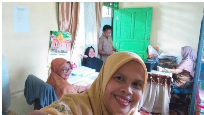
Dokumentasi Kegiatan monev pelaksanaan APB Nagari