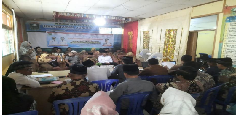
Dokumentasi kegiatan Musrenbang Selasa 4 Maret 2025